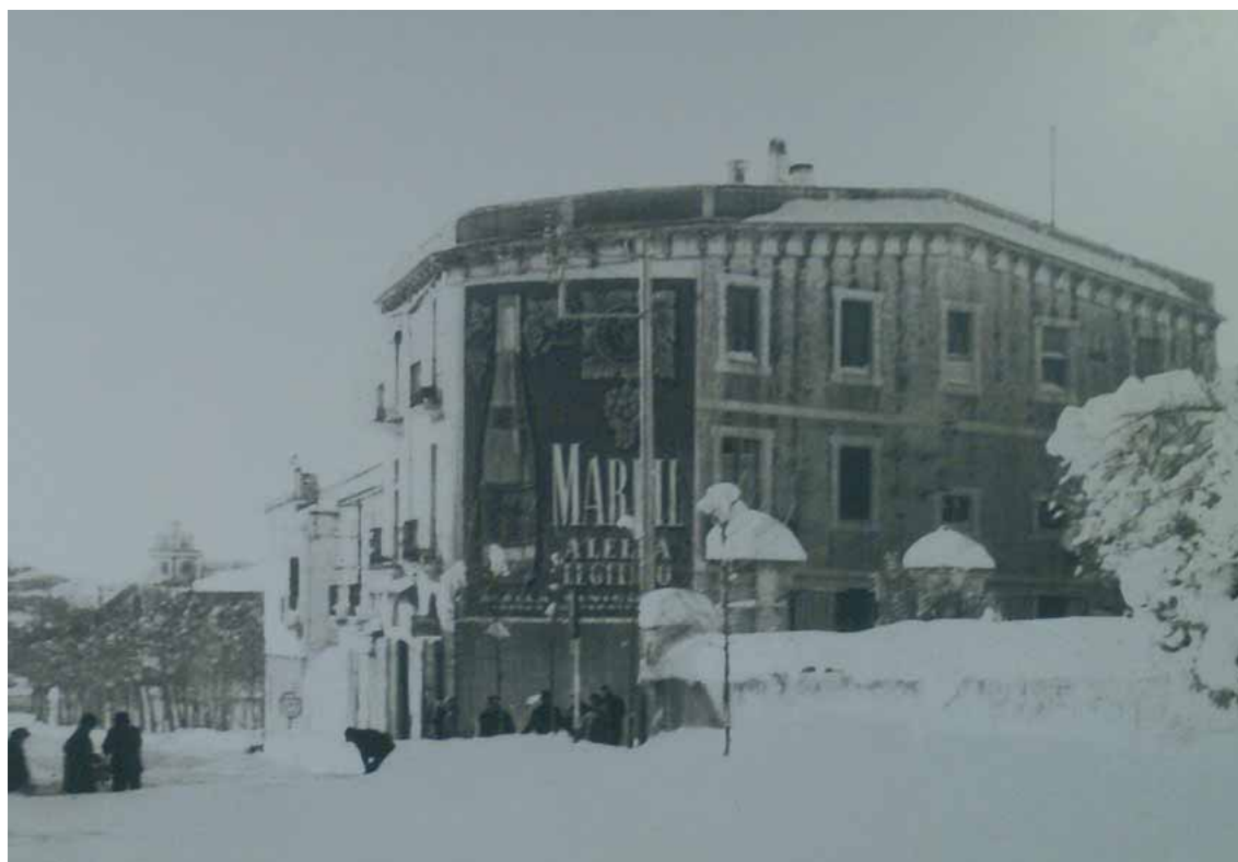
La Rambla d'Àngel Guimerà després de la gran nevada de 1962.

A falta d'una recerca curiosa, es desconeix l'any exacte de la seva creació, però les postals d'època demostren que no seria fins ben entrada la postguerra per substituir, a la part baixa d'aquesta façana, el lema “ Arriba España ” i el símbol falangista del jou i les fletxes. Amb petites variacions al llarg dels anys, a l'anunci, en forma de rectangle allargassat, destacava una gran ampolla de Marfil al costat esquerre, amb gotims de raïm a la seva part superior només presents a les imatges més antigues. Al costat dret, de dalt a baix i de dimensions més petites, l'escut de l'Alella Vinícola envoltat de pàmpols, d'on penjava un gotim de raïm ben carregat i les lletres Marfil Alella Legítimo primer i anys després només Marfil Alella. A la part inferior, en