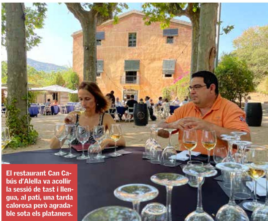
El restaurant Can Cabús d'Alella va acollir la sessió de tast i llengua, al pati, una tarda calorosa però agradable sota els plataners.

SC: Efectivament, el cava –com els vins de xerès– és una de les begudes més versàtils que hi ha. I quan parlem de versatilitat parlem d'això: te'l pots prendre pel simple plaer de tastar-lo. I alhora són begudes que t'ajuden molt gastronòmicament, perquè combinen amb tota mena de plats. Quan no saps què posar-hi, posa-hi un cava.