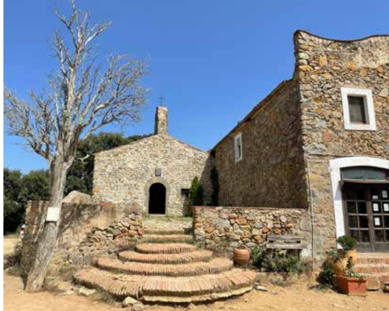
I vam arribar fins a l'ermita de Sant Mateu.