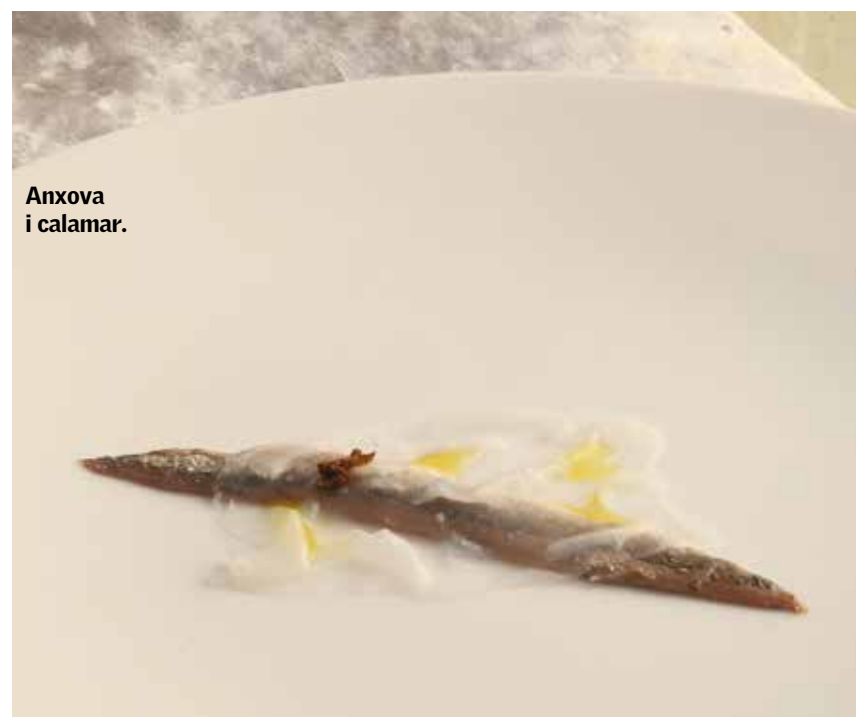
Anxova i calamar.