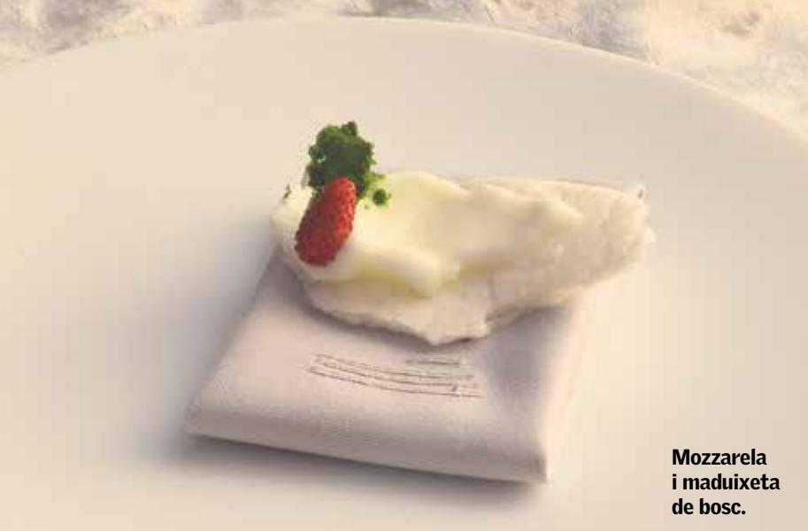
Mozzarella i maduixeta de bosc.