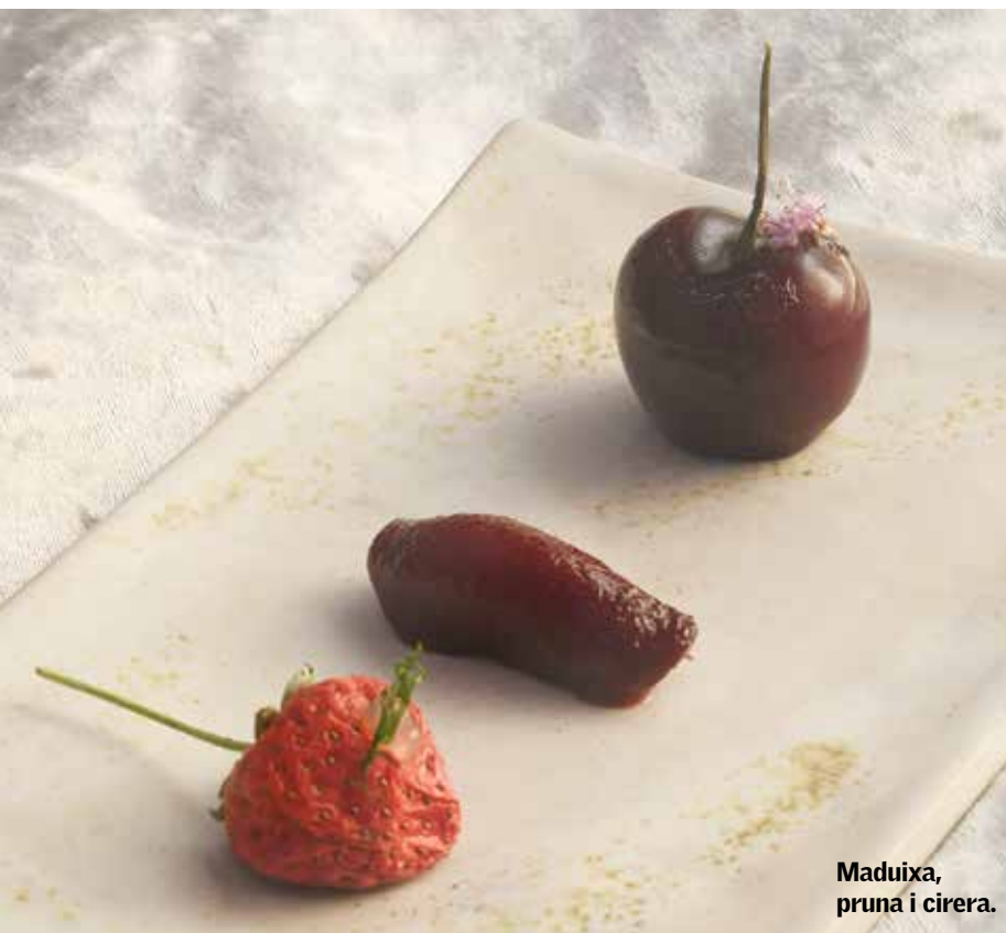
Maduixa, pruna i cirera.

molta aigua... és el cogombre ploraner." Per elaborar-lo, el fan al vapor, el tallen i el marquen a la brasa. "Però continua necessitant potència, alguna cosa que el destaqui, i és per això que preparem una salsa hoishin (la que dona sentit a