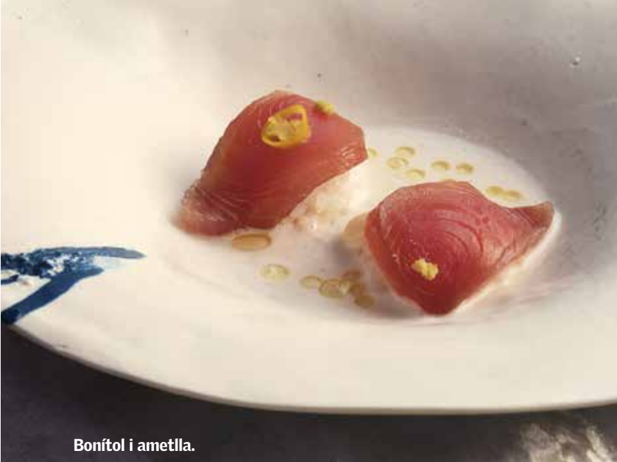
Bonítol i ametlla.