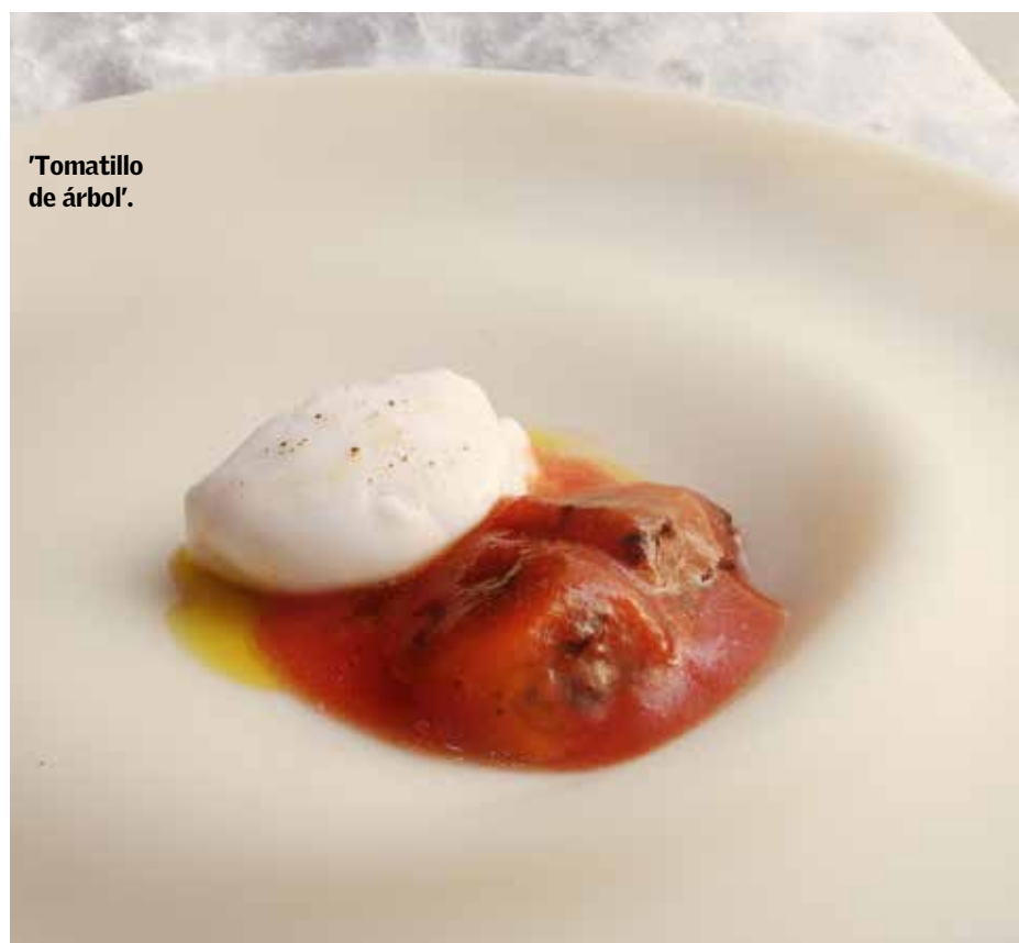
'Tomatillo de árbol'.

da i del menjar, i quan fas una cuina tan directa, tan basada en el producte, has d'anar alerta de no perjudicar la beguda que el pot acompanyar", referint-se al maridatge de plats més complexos com poden ser les carxofes o els espàrrecs. "En el món de les begudes hi ha moltes opcions, però no soc partidari de posar un vermut o una cervesa torrada enmig d'un menú, per exemple."