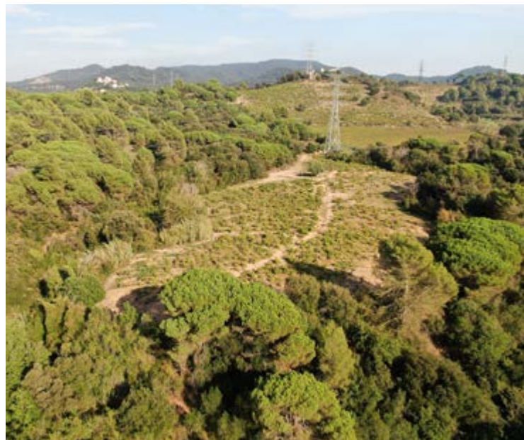
La Vinya del Músic (Sant Fost), envoltada de bosc.