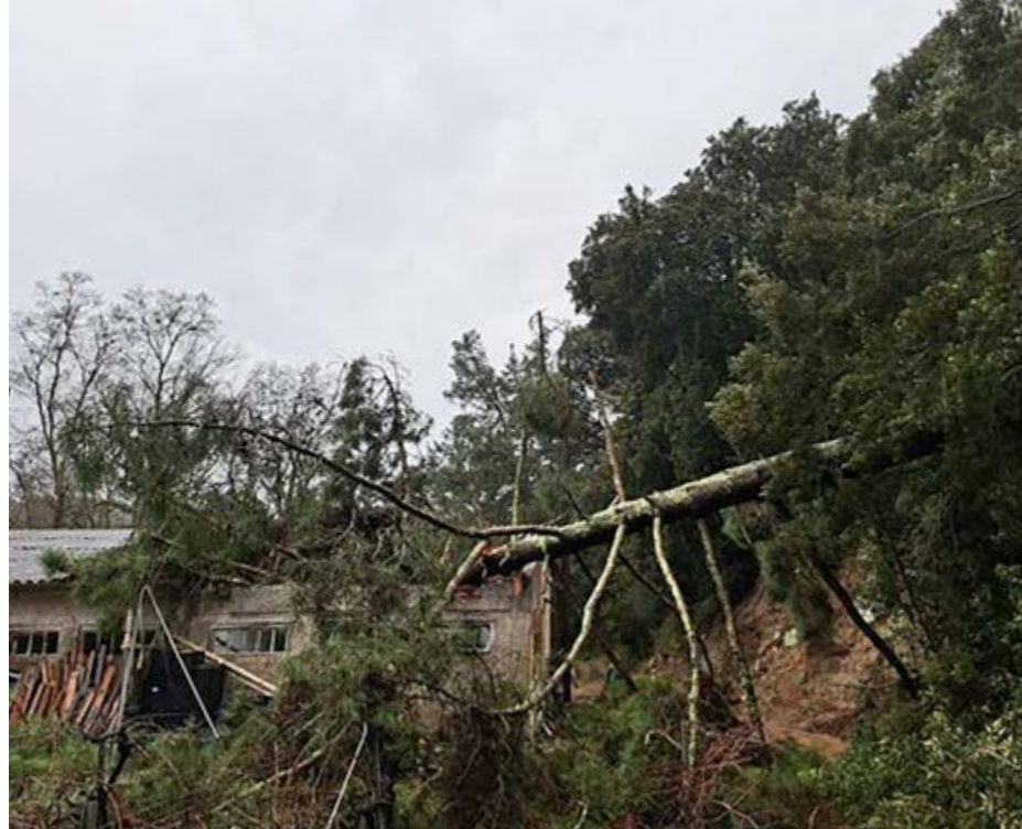
Un pi de grans dimensions va caure a sobre el celler, arran de la tempesta Harry, a finals de gener.

Continua: “Al Maresme trobem moltes iniciatives que comparteixen idees comunes, però totes fan la seva guerra. Jo penso fermament que vivim en un paradís, que el Maresme