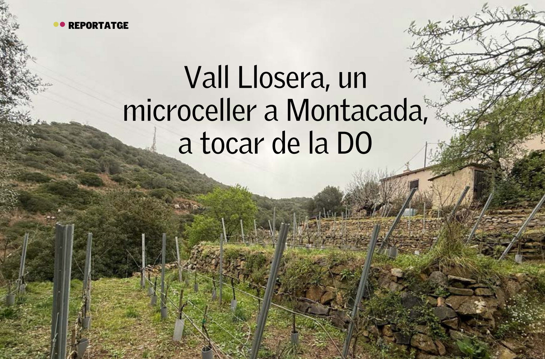
Terrasses de pedra seca recuperades per a la plantació de vinya a la Vall Llosera, a Montcada i Reixac.