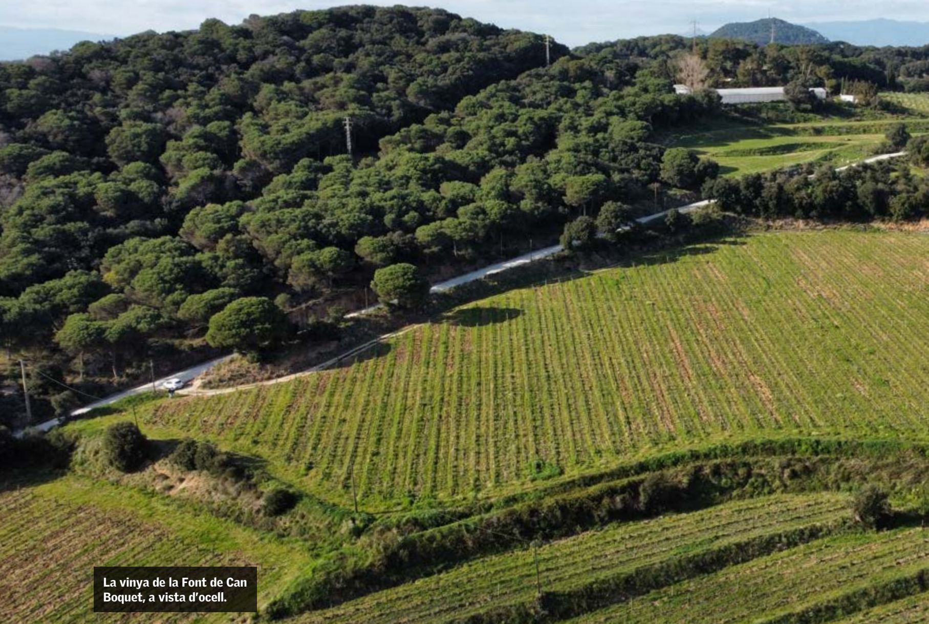
La vinya de la Font de Can Boquet, a vista d'ocell.