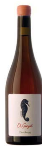
El Gínjol Oriol Artigas Sense DO

Varietats: 80% pansa blanca, 20% garnatxa negra Anyada a la venda: 2019 Més dades: Agricultura ecològica. Sense sulfits afegits. Llevats autòctons, fermentació espontània. Maceració conjunta: pansa blanca desrapada i garnatxa negra amb raïm sencer. Set mesos de criança sobre mares. Sense filtrar ni clarificar. Disponible en format màgnum (PVP: 40 €).