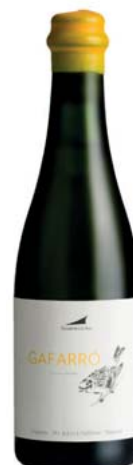
AA Gafarró Alta Alella Sense DO

Varietats: Pansa blanca Anyada a la venda: 2017 Més dades: 106 g/l de sucre. Agricultura ecològica. Raïm criomacerat durant divuit hores. Fermentació a molt baixa temperatura i aturada de manera natural. Ampolla de 0,375 litres.