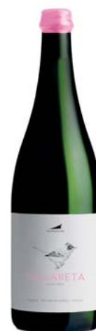
AA Tallareta Celler de les aus DO Alella

Varietats: Pansa rosada Anyada a la venda: 2019 Més dades: Agricultura ecològica. Sense sulfits afegits. Vi de parcel·la: Coster de Salvans (Tiana), plantada el 1959. Criança sobre mares en dipòsits ovals de ciment basats en argila ( oeuf de Beaune ).