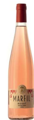
Marfil Rosat Alella Vinícola DO Alella

Varietats: Garnatxa negra Anyada a la venda: 2019 Més dades: Agricultura ecològica. Certificat vegà.