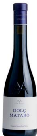
AA Dolç Mataró Alta Alella Sense DO

Varietats: Mataró Anyada a la venda: 2018 Més dades: 196 g/l de sucre. Agricultura ecològica. Raïm veremat al començament de la sobremaduració. Sis mesos de maceració. Dos mesos de cria en barrica. Ampolla de 0,375 litres.