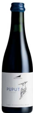
AA Puput Alta Alella Sense DO

Varietats: Mataró Anyada a la venda: 2018 Més dades: 200 g/l de sucre. Agricultura ecològica. Raïm sobremadurat sense arribar a pansificar. Sis mesos de maceració en barrica. Aturada de la fermentació de manera natural. Ampolla de 0,375 litres.