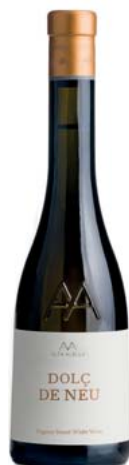
Alta Alella Dolç de neu Alta Alella Sense DO

Varietats: Pansa blanca Anyada a la venda: 2017 Més dades: 114 g/l de sucre. Agricultura ecològica. Raïm criomacerat durant divuit hores. Fermentació en barrica i aturada de manera natural. Ampolla de 0,375 litres.