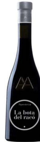
La bota del racó Papers de vi Sense DO

Varietats: Varietat negra Anyada a la venda: 2007 Més dades: Dolç i ranci. Elaborat per Alta Alella. Agricultura ecològica. Vuit vi de Papers de vi . Producció limitada de 300 ampolles. Provenint d'una bota "oblidada" en un racó del celler Alta Alella. Ampolla de 0,375 litres.