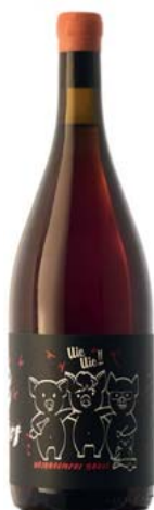
3 Porcs! Oriol Artigas / Tuets / Frisach Sense DO

Varietats: 27% pansa blanca, 27% macabeu, 27% parellada, 6% garnatxa negra, 6% moscatell, 6% carinyena Anyada a la venda: 2019 Més dades: Agricultura ecològica. Sense sulfits afegits. Vi elaborat entre tres amics amb cellers a Alella, la Terra Alta i el Penedès. Dues varietats de cada territori; maceració conjunta de tots els raïms. Set mesos de criança sobre mares. Llevats autòctons, fermentació espontània. Sense filtrar ni clarificar.