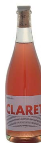
Claret Papers de vi Sense DO

Varietats: Pansa blanca, garnatxa negra, mataró, sumoll Anyada a la venda: 2018 Més dades: Elaborat pel celler Oriol Artigas. Agricultura ecològica. Sense sulfits afegits. Setè vi de Papers de vi . Llevats autòctons, fermentació espontània. Tres mesos de criança en inox i en barrica. Producció limitada de 300 ampolles.