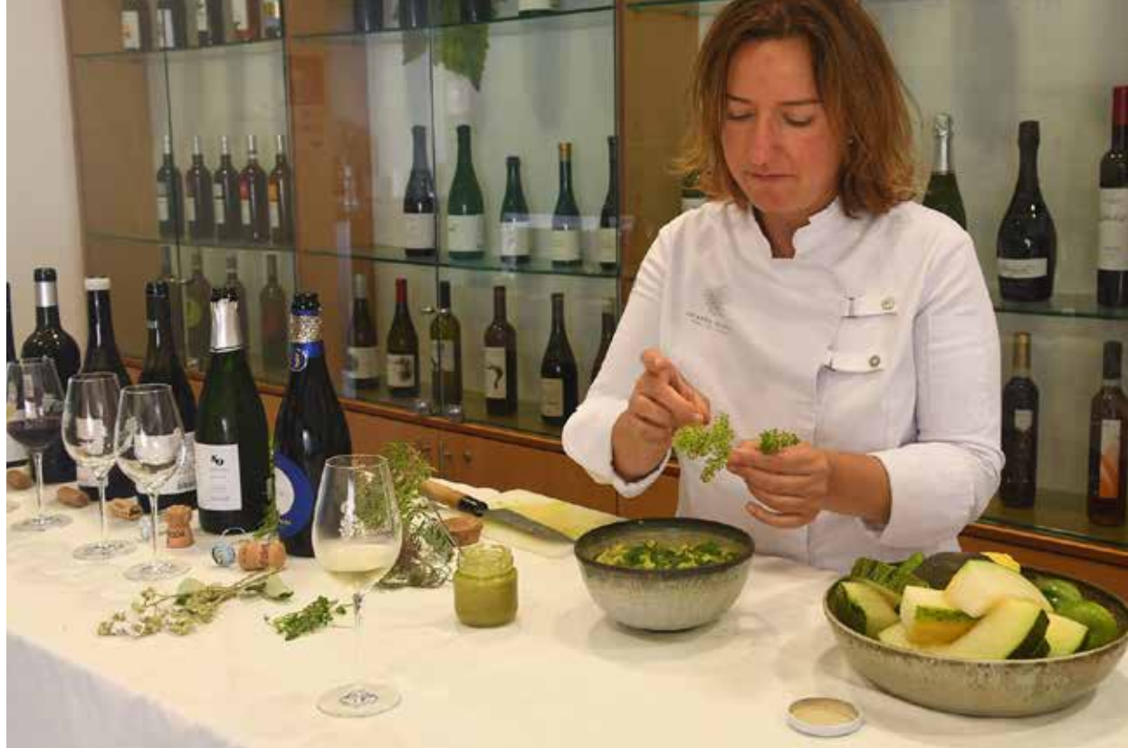
Afegint flors de raïm a l’amanida verda que va preparar per a nosaltres.

corretjoles i llentiscle, tot amb la seva corresponent explicació. Del llentiscle ens explica que es feia servir per fer cola, mentre que els dentistes la utilitzaven per fer amalgames. Ella n’utilitza els granets, similars al pebre, per assecar-los i utilitzar-los en els plats de caça. “Té molt gust de sotabosc i una olor molt característica en vins negres, sobretot en aquells més especiats com els de syrah.” I podríem omplir les pàgines d’aquesta revista parlant de totes les plantes que vam conèixer en les dues hores aproximades de recorregut: l’estepa negra, que abans d’obrir-se fa olor de tomàquet verd; l’hipèric, conegudíssim per ser el principal ingredient de l’oli de cop o per tenyir de vermell; la Viborea , de la família de les borratges, una planta en forma de serp -d’aquí ve el nom-; el crespinnell, amb