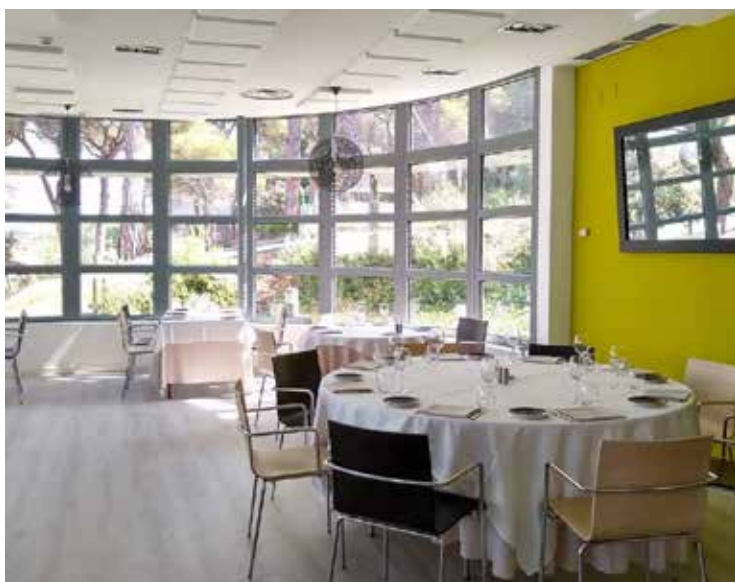
L'espaiós i agradable menjador del restaurant Trànsit.