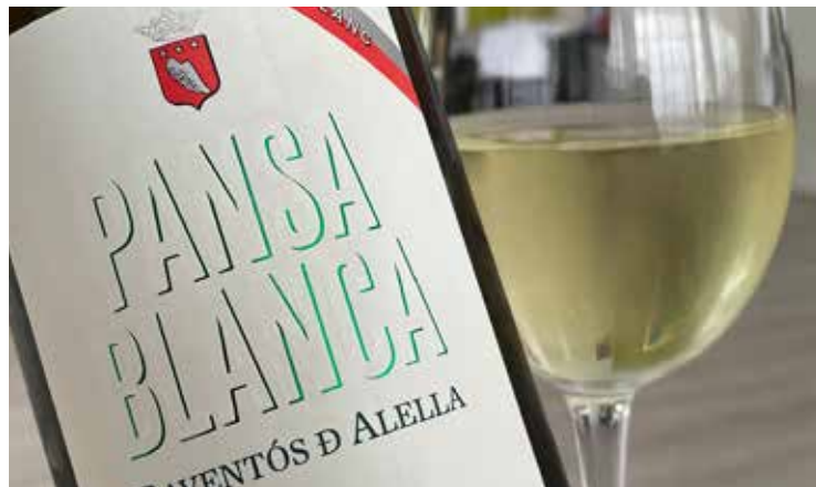
El Raventós d'Allella Pansa Blanca és el vi de la casa del restaurant.