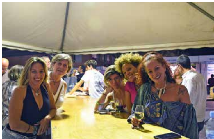
Tres imatges de l'edició 2019 de la Mostra Gastronòmica de Cabriels, la darrera que es va poder celebrar amb normalitat.

responsabilitat. Estem fent actes amb diners públics, cap veí se'n pot sentir exclòs. A l'ajuntament ara treballem més transversalment que mai, les regidories són molt líquides i necessitem escoltar els tècnics de totes les àrees implicades: davant les dificultats, o fas pinya o hi ha trencadissa. I, afortunadament, fem pinya. I les coses acaben sortint: hem fet uns Reis especials i els nens hi tenien videoconferències; per la Festa Major del maig del 2020 els músics ens van fer concerts des de casa... La gent agraeix que no s'anul·lin les festes. Sempre hi ha qui ho troba innecessari, però llavors els recordo que, darrere la diversió d'una Festa Major, sempre hi ha professionals que s'hi guanyen la vida i aquesta pandèmia els està fent patir molt.