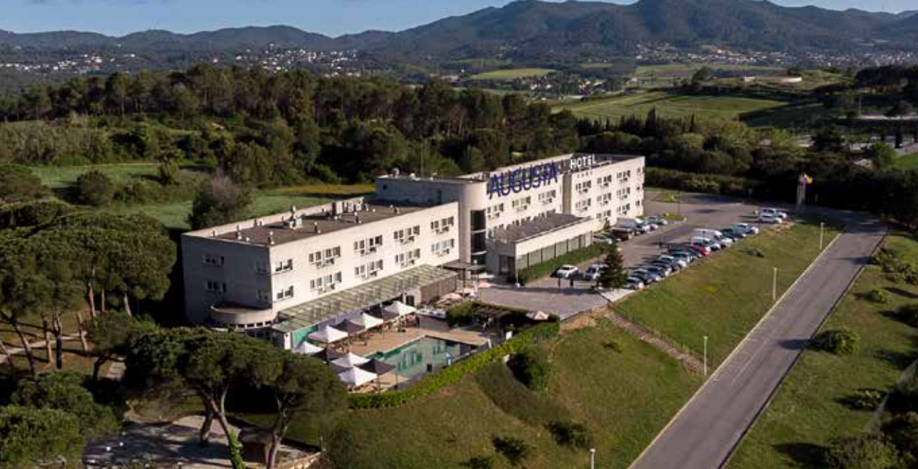
Foto de dron de l'hotel Augusta.