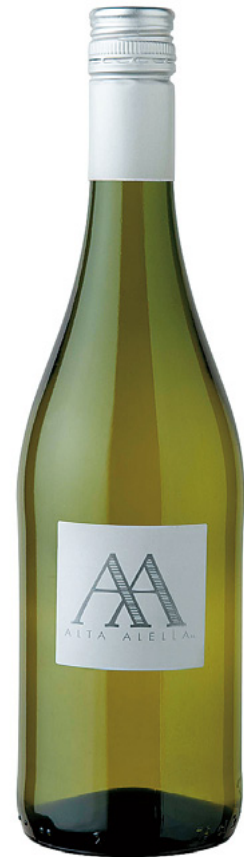
Alta Alella Pansa Blanca DO Alella Varietat: pansa blanca

Camí Baix de Tiana, Finca Can Genís · Tiana www.altaalella.cat