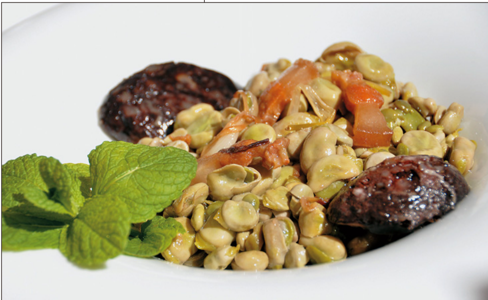
Faves del nostre hort a la catalana.

Can Roca, s/n · Tiana Tels. 93 395 07 47 - 93 395 57 07 www.restaurantcanroca.com