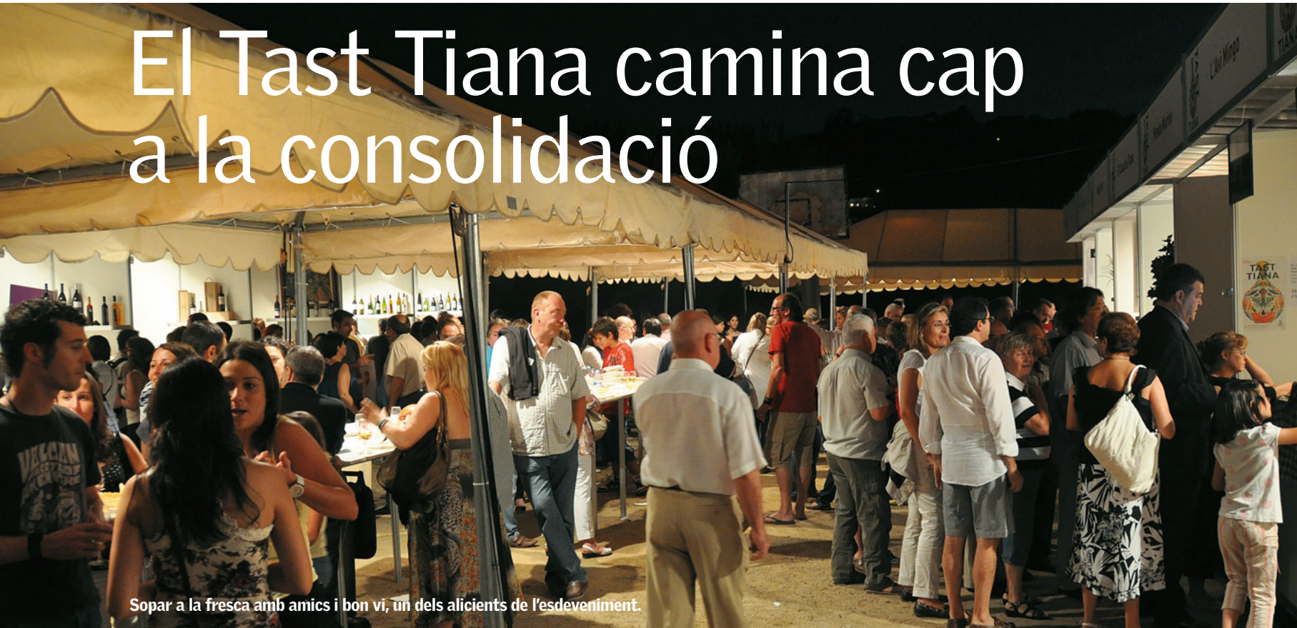
Sopar a la fresca amb amics i bon vi, un dels alicients de l'esdeveniment.

Els vuit cellers de la DO Alella i fins a dotze restaurants es donen cita en aquesta proposta gastronòmica, que complementa el programa amb activitats de tast, tallers infantils i concerts de música