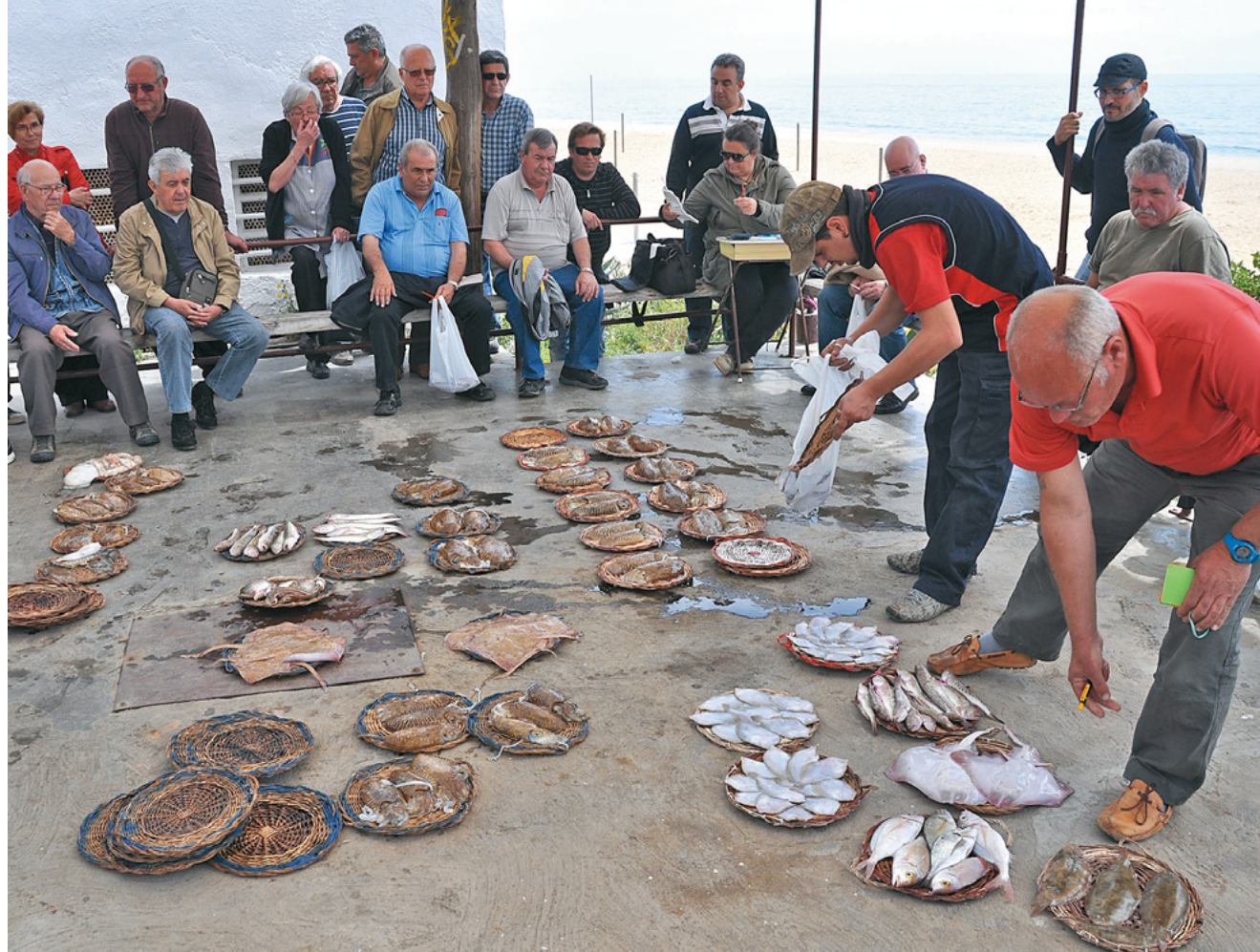
Compradors i curiosos s'apleguen al voltant de les paneres de peix, a la llotja de Montgat.