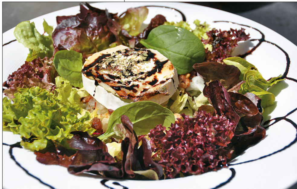
Amanida tèbia amb fruits secs i formatge de cabra amb reducció de vi de taronja.

Isaac Albènz, 8-10 · Tiana Tels. 93 395 23 03 - 618 326 060 www.casaldetiana.amawebs.com