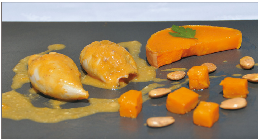
Calamarcets farcits de pernil amb salsa de carbassa i ametlles.

Ctra Badalona - Mollet, km 7,6 Sant Fost de Campsentelles Tels. 93 570 61 28 - 93 593 55 55 www.mascorts.com