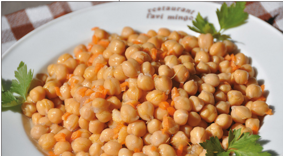
Cigrons d'Astorga sortits de l'olla amb oli d'oliva verge.

Lola Anglada, 28 · Tiana Tels. 93 395 22 06 - 696 458 355 www.avimingo.com