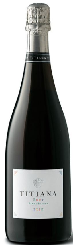
Parxet Pansa Blanca DO Cava Varietat: pansa blanca