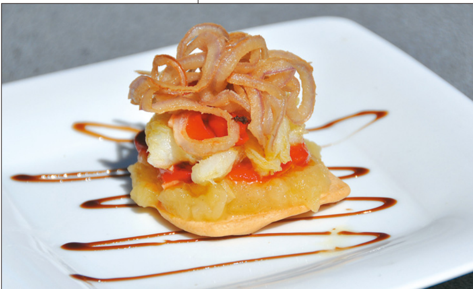
Barqueta de bacallà confitat amb compota de poma.

Plaça de la Vila, 6 · Tiana Tel. 93 118 26 75 www.tirati.es