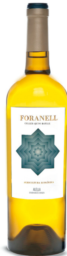
Foranell DO Alella Varietats: pansa blanca, garnatxa blanca, picapoll

La Sentiu, s/n · Tiana www.vinosdealella.com