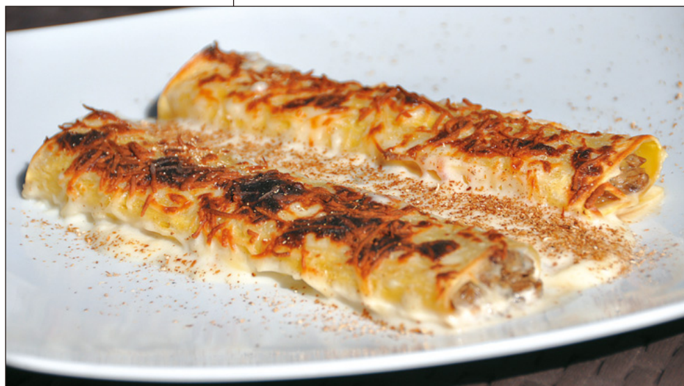
Canelons de ceps amb salsa de tòfona.

Camí Dalt d'Alella, 15 · Tiana Tel. 93 395 38 12