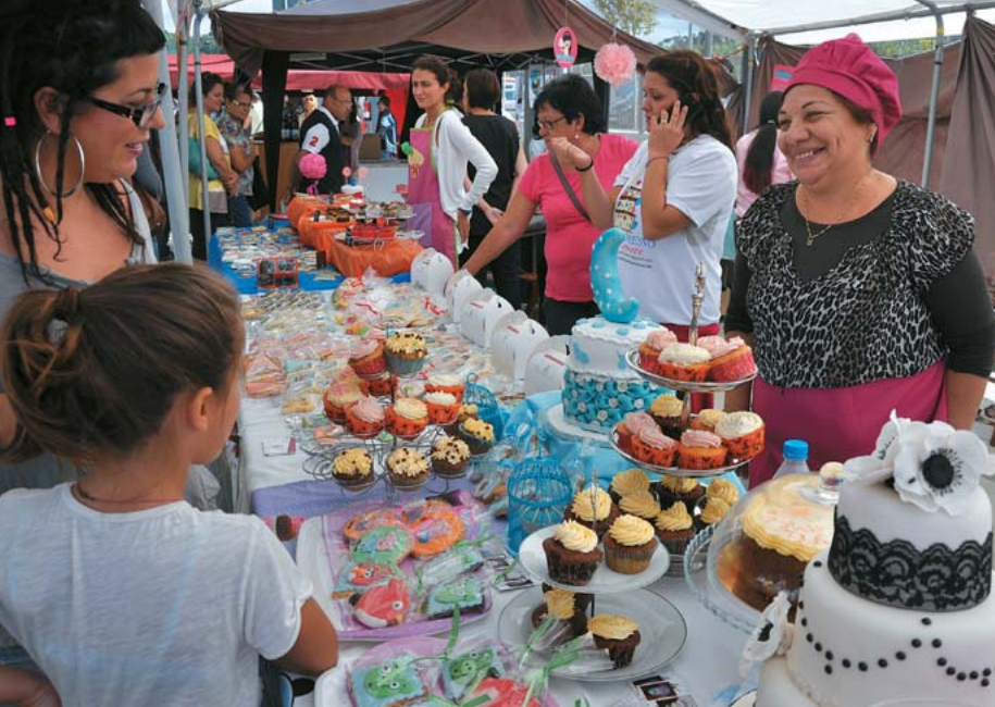
Les bloggers llaminereres van impressionar tothom amb les seves creacions.