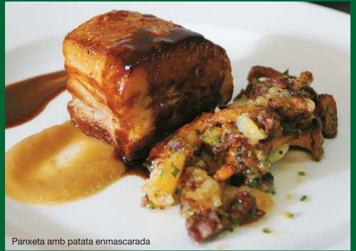
Panxeta amb patata enmascarada

Passeig d'Antoni Borrell, 13 Can Doctor 08328 Alella Telèfon 935 40 17 94