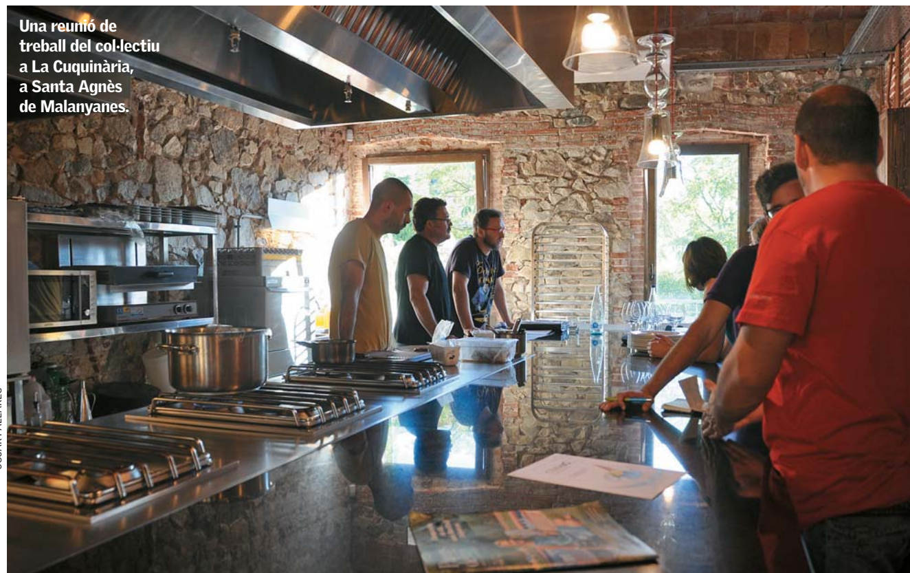
Una reunió de treball del col·lectiu a La Cuinària, a Santa Agnès de Malanyanes.

Com assaja Petrini i forma part del corpus filosòfic de l'slow food: "La gastronomia és una ciència que estudia la felicitat. A través del menjar, llenguatge universal i immediat, element d'identitat i objecte d'intercanvi, es configura una de les forces més poderoses de la diplomàcia de la pau." ●