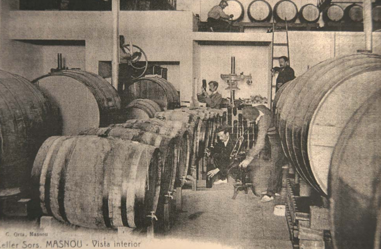
El celler Sors, en plena activitat.

prés d'oferir un recital benèfic al Casino del Masnou el 1927 i que el qualificà d'excel·lent. En aquesta etapa especialment reeixida, el Champ-Sors era una beguda habitual en hotels i recepcions, protagonitzava presents institucionals a personalitats i diplomàcia.