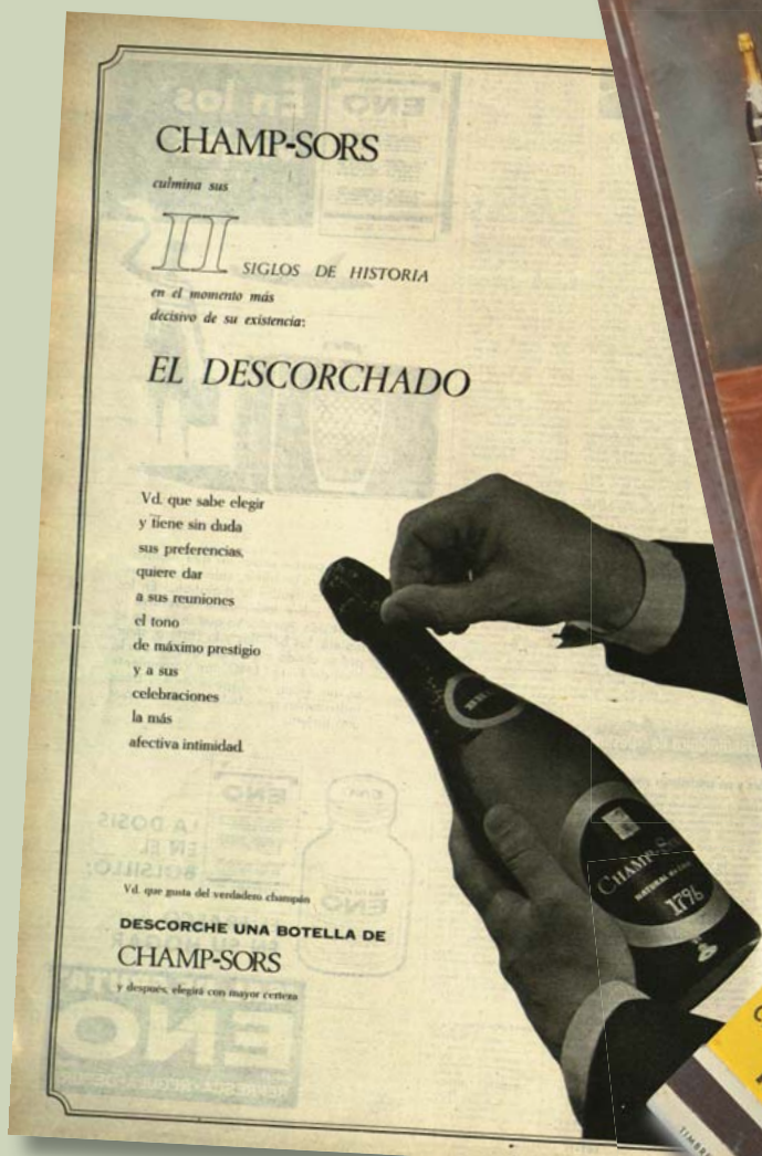
Anunci publicat a la revista Destino de novembre de 1964.