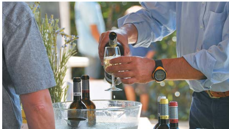
Els vins servits a totes dues fires són DO Alella.

TEXT: ARIADNA GUASCH