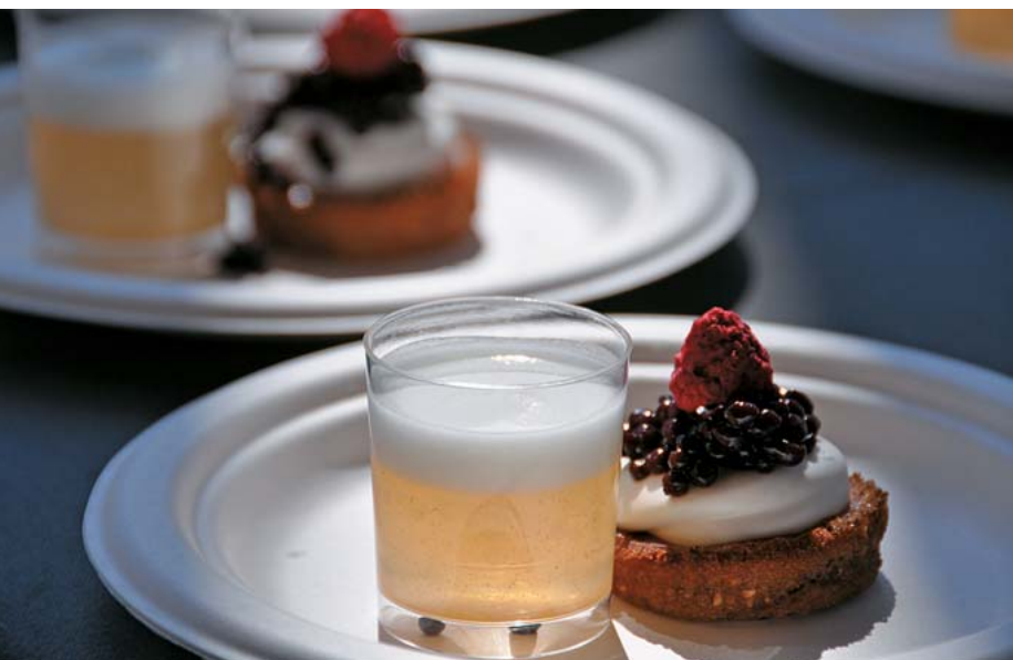
Aquestes originals postres inspirades en Rússia van ser la proposta dolça que el restaurant Sauló va preparar per la Jornada de Tastets de Vallromanes.

les previsions inicials que havien fet per a l'elaboració dels seus plats. A més, en aquesta jornada gastronòmica es va posar un segell de qualitat alimentària a tots els establiments que manipulaven menjar per garantir el compliment de la normativa sanitària, un fet innovador en l'àmbit de les fires.