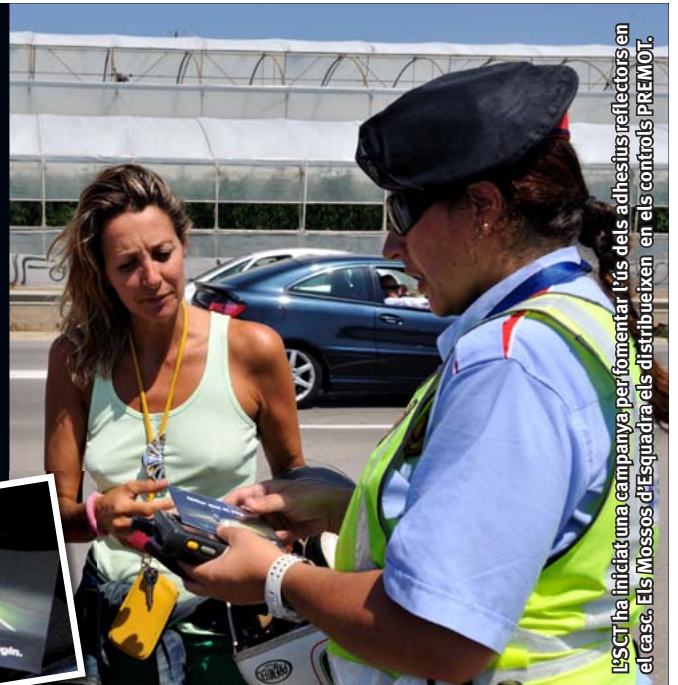
L'SCT ha iniciat una campanya per fomentar l'ús dels adhesius reflectors en el casc. Els Mossos d'Esquadra els distribueixen en els controls PREMOT.