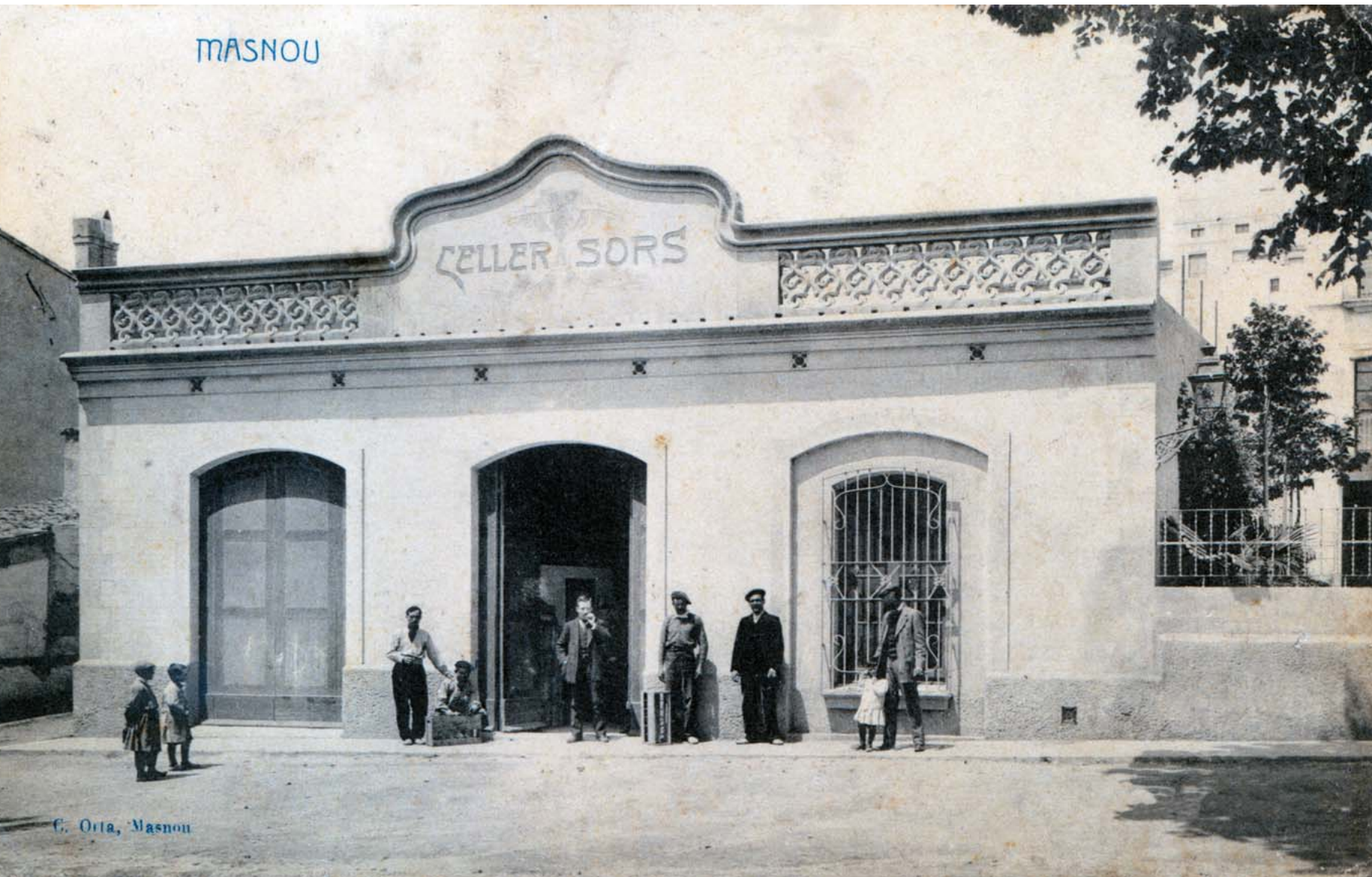
Postal dels anys 1920 que mostra l'edifici antic on s'ubicava el celler Sors.