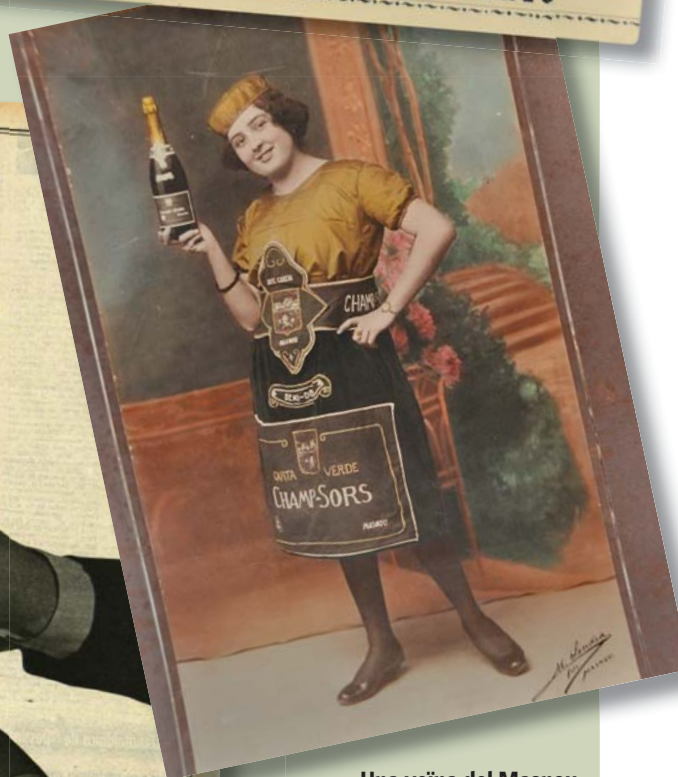
Una veïna del Masnou disfressada d'ampolla de Champ-Sors amb ocasió d'una fira comercial celebrada en aquest municipi l'any 1957.