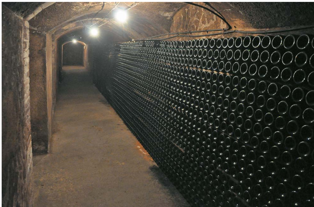
Imatge actual de les caves, excavades en el sauló, a tocar del mar.

El vi Unicus era un dels vins tranquils que s'elaborava al celler Sors.