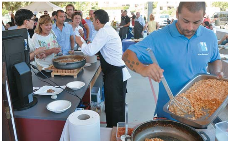
Les cues van ser constants per degustar les propostes del restaurant Sant Miquel a la Jornada de Tastets.

llant amb les mans. El context econòmic actual impedeix en molts casos de realitzar desplaçaments llargs i els canvis en el món laboral empenyen a buscar alternatives de feina; en aquest sentit, les aficions per crear productes originals es poden convertir en possibilitats reals de feina. I és en aquest punt on es troben participants i assistents; les fires són un lloc d'encontre entre els qui ofereixen els seus productes més preuats amb els qui valoren la proximitat i una manera de fer diferent de la que fa alguns anys estàvem habituats. Alimentació, disseny i artesanía són camps