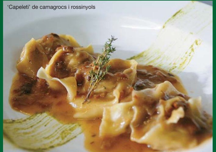
'Capeleti' de camagroc i rossinyols