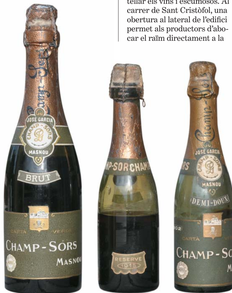
Tres ampolles de mida petita de Champ-Sors. La del mig correspon a l'anyada 1915 i la de la dreta a la 1902.

gerent. Hi havia cinc treballadors fixos." La dècada del 1950 s'enderrocà una part de l'edifici original de Champ-Sors i davant els cellers (que encara es mantenen) es va construir un bloc de pisos als baixos del qual es va instal·lar la premsa i una part de la maquinària emprada per elaborar i embotellar els vins i escumosos. Al carrer de Sant Cristòfol, una obertura al lateral de l'edifici permet als productors d'abocar el raïm directament a la