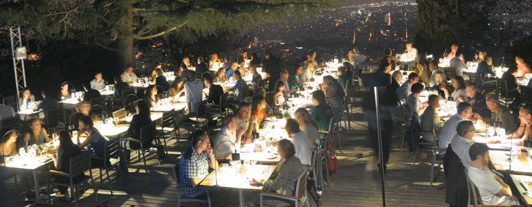
Sopar amb vistes a Barcelona, a la terrassa de l'Observatori Fabra.