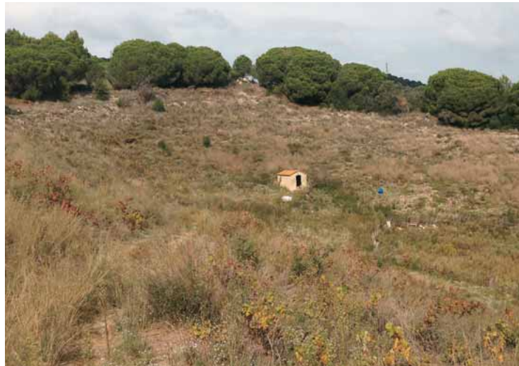
Vinya de l'Esqueixa.