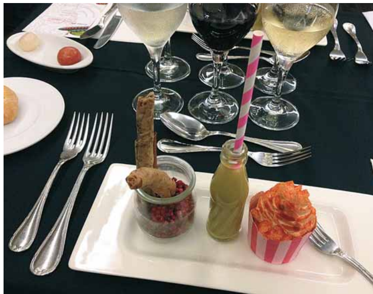
Llepolies mentideres, el primer plat del "Sopar dels sentits".