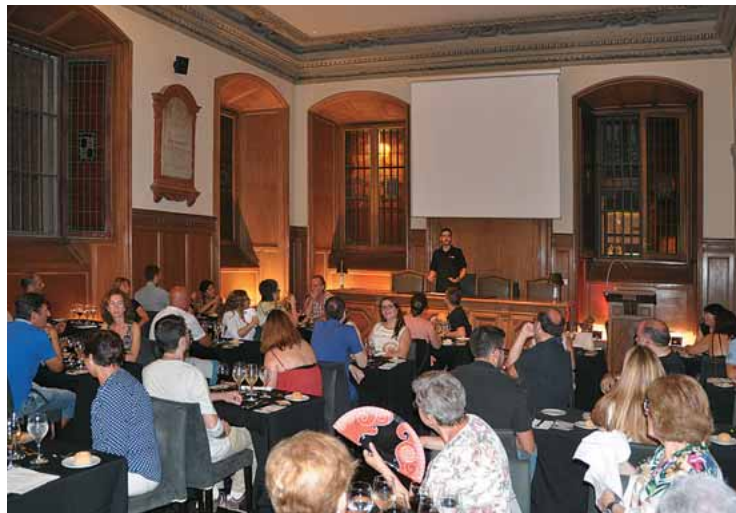
Un responsable d'Sternalia dóna instruccions al "Sopar dels sentits".

pinzellada de la vida i els costums de la comunitat jueva a Barcelona a l'època medieval). En un àmbit més estrictament científic, Sternalia proposa cursos d'astronomia i visites guiades al sincrotró Alba. Una manera d'acostar-se a la ciència i cultura des de punts de vista diferents. ●