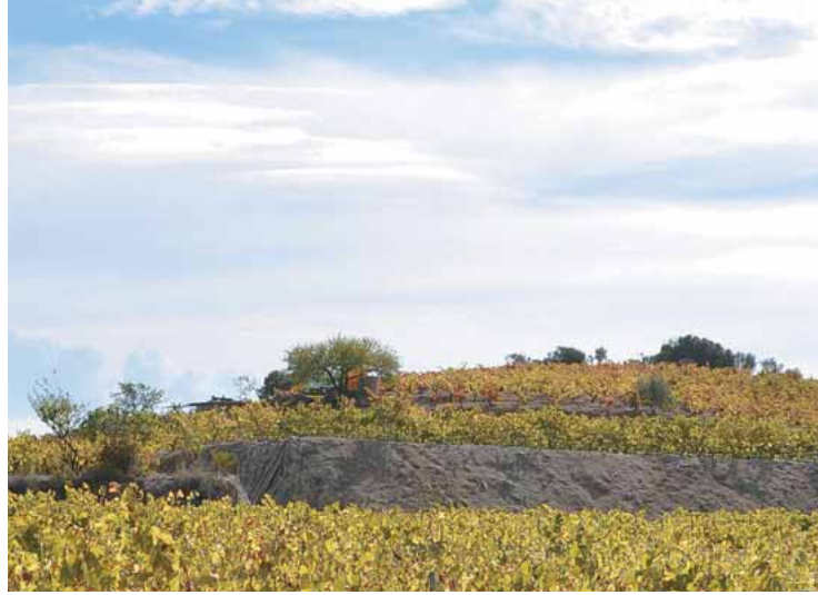
Vinya del Turó del Bessó.