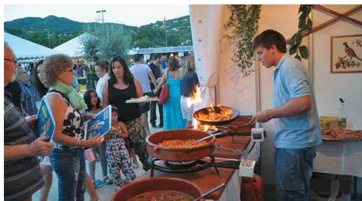
Un cuiner del restaurant Cal Gras flameja uns llagostins.

Èxit de públic un any més a la 28a Mostra Gastronòmica, Comercial i d'Artesans de Cabrils, que es va fer entre el 14 i el 17 d'agost. En l'edició d'aquest any d'una de les cites ineludibles del calendari festiu de la comarca del Maresme es van instal·lar 67 estands: 19 de restauració, 10 de comerciants, 5 de vins DO Alella, 6 d'entitats i 27 paradetes d'artesans. El 0,7% de la venda de cada tiquet de tast i beguda anava destinat a Càritas Parroquial de Santa Creu de Cabrils. D'una altra banda, entre les activitats complementàries es va fer la 10a Trobada de Col·leccionistes de Plaques de Cava de Cabrils i l'estand de Parxet va vendre cava amb la placa commemorativa de la Mostra Gastronòmica 2015.