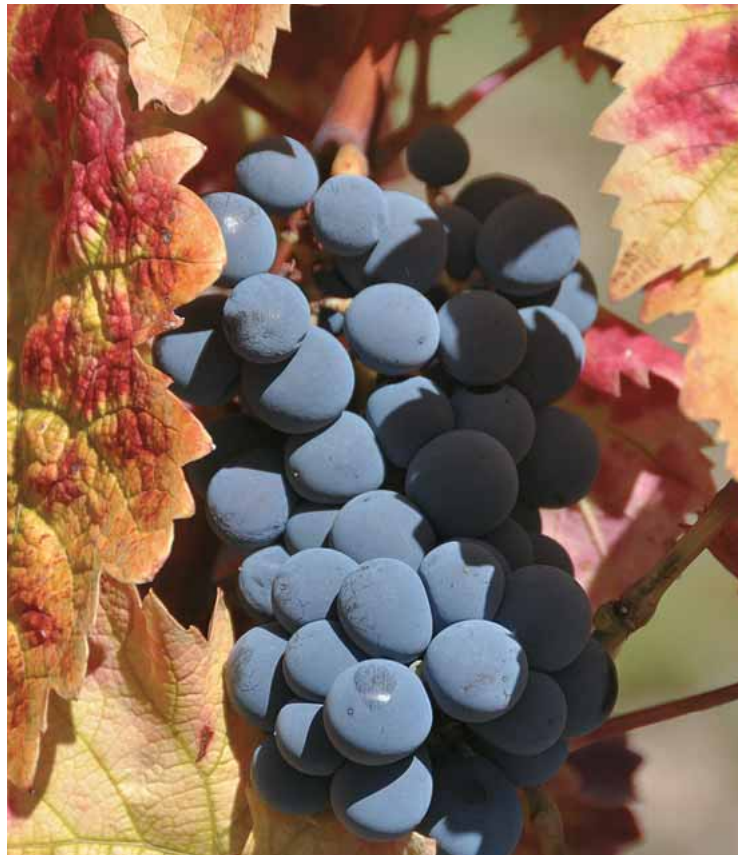
Raïm de la varietat desconeguda, pocs dies abans de ser veremat.