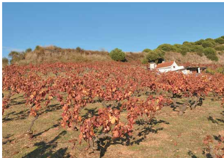
Vinya Rials de Dalt.

negra, i ho atribueix a un error en el procés de catalogació.