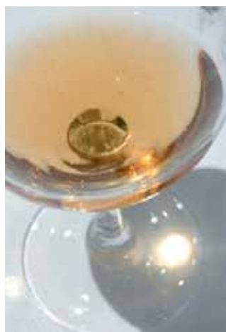
Imatges de diversos "tasts de fusió" fets per la sommelier a Alella. A baix a l'esquerra, membres del Club de Tast l'Arcada