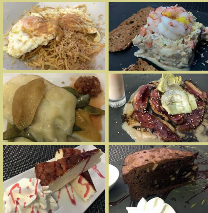
Ous amb niu de patates palla, oli de tòfona blanca i foie. Timbal d'ensaladilla russa amb gambes i perles de yuzu. Bacallà a baixa temperatura sobre llit d'espínacs i muselina de poma. Tataki de magret d'ànec amb parmentier de truita de patates. Pastís de formatge. Brownie de xocolata.