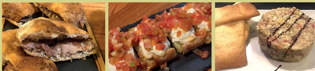
Bikini trufat de porchetta. Burrata fumada amb anxoves. Tàrtar de carxofa i anxoves.