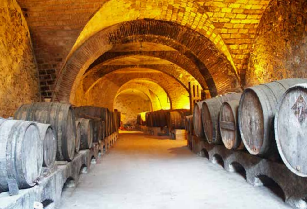
Celler de Can Bruguera.