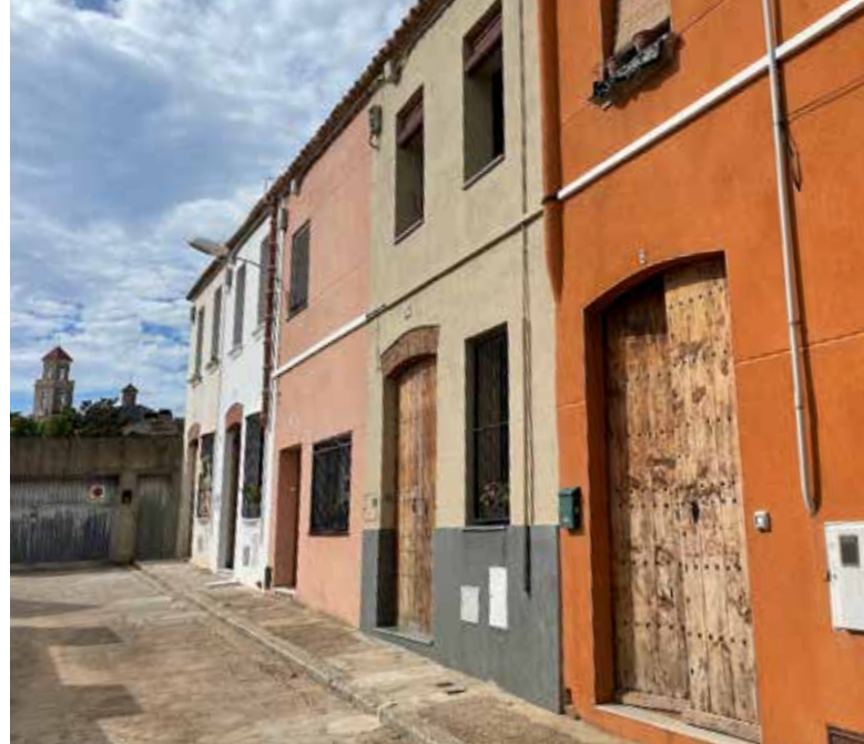
Cases de cos a un carrer del centre urbà.