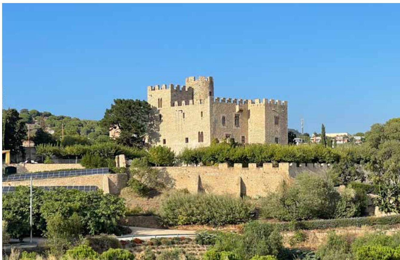
El castell de Vilassar de Dalt sembla sortit d'una pel·lícula.

La història comença abans que Vilassar tingués aquest nom. Molt abans de l'any 978, quan s'ha trobat la primera constància escrita del topònim Villazzari . És bonic situar els orígens en les planes de Can Boquet, on fa prop de 4.000 anys es va aixecar un dolmen, i tot un seguit de coves d'enterrament. Els jaciments es poden visitar en una Ruta Prehistòrica que inclou la Roca d'en Toni, els Rocs d'en